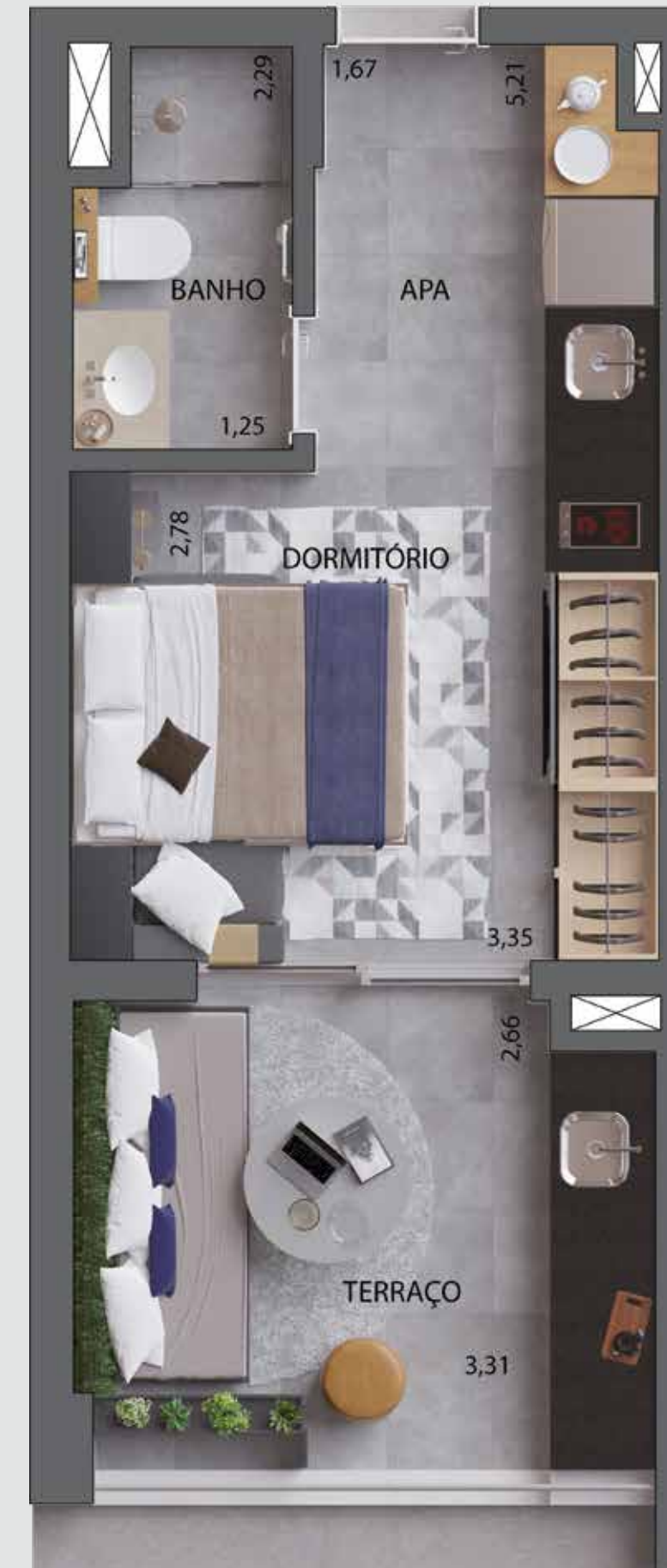
PLANTA COM SUGESTÃO DE DECORAÇÃO DO STUDIO DE 30 M 2 - FINAL 9

QUALQUER MODIFICAÇÃO NO APARTAMENTO QUE IMPLIQUE NA ALTERAÇÃO DO PROJETO ORIGINAL DA FACHADA DEVERÁ SER APROVADA NA ASSEMBLEIA DO CONDOMÍNIO. EVENTUAIS ADEQUAÇÕES NAS INSTALAÇÕES ELÉTRICAS E/OU HIDRÁULICAS SERÃO POR CONTA E RESPONSABILIDADE DO CLIENTE, DEVENDO OBSERVAR AS RECOMENDAÇÕES INDICADAS NO MANUAL DO PROPRIETÁRIO.