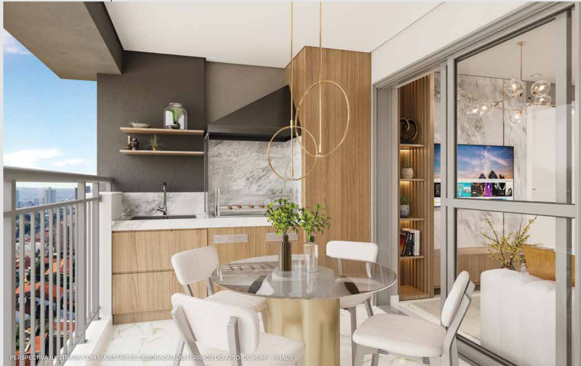
PERSPECTIVA ILUSTRADA COM SUGESTÃO DE DECORAÇÃO DO TERRAÇO DO APTO. DE 46 M 2 - FINAL 3

QUALQUER MODIFICAÇÃO NO APARTAMENTO QUE IMPLIQUE NA ALTERAÇÃO DO PROJETO ORIGINAL DA FACHADA DEVERÁ SER APROVADA NA ASSEMBLEIA DO CONDOMÍNIO. EVENTUAIS ADEQUAÇÕES NAS INSTALAÇÕES ELÉTRICAS E/OU HIDRÁULICAS SERÃO POR CONTA E RESPONSABILIDADE DO CLIENTE, DEVENDO OBSERVAR AS RECOMENDAÇÕES INDICADAS NO MANUAL DO PROPRIETÁRIO.