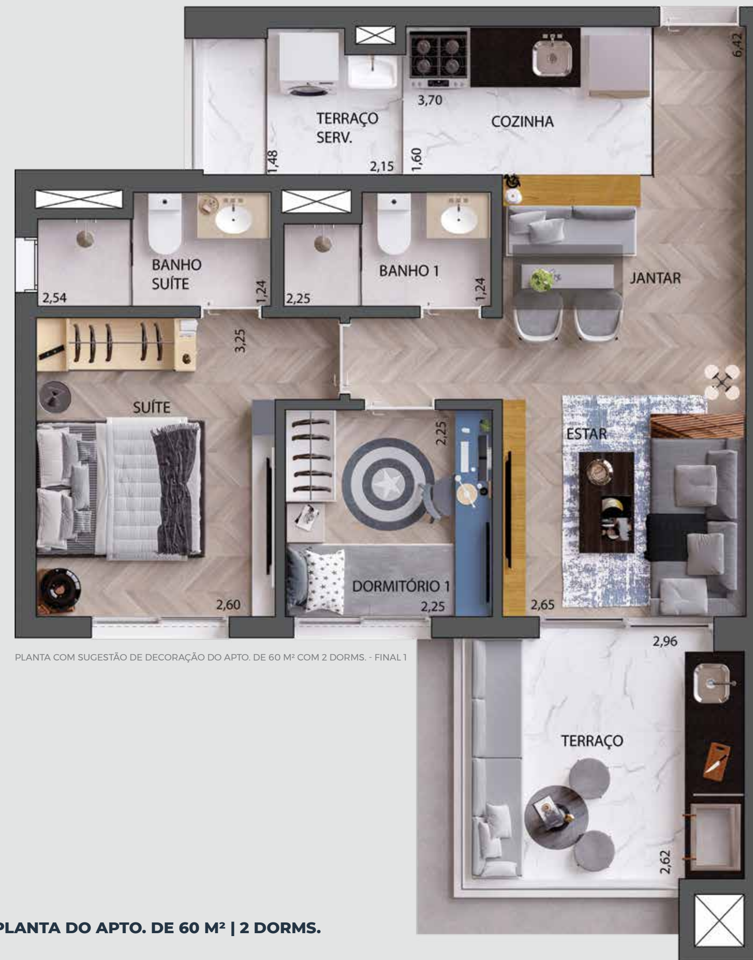
PLANTA COM SUGESTÃO DE DECORAÇÃO DO APTO. DE 60 M 2 COM 2 DORMS. - FINAL 1

QUALQUER MODIFICAÇÃO NO APARTAMENTO QUE IMPLIQUE NA ALTERAÇÃO DO PROJETO ORIGINAL DA FACHADA DEVERÁ SER APROVADA NA ASSEMBLEIA DO CONDOMÍNIO. EVENTUAIS ADEQUAÇÕES NAS INSTALAÇÕES ELÉTRICAS E/OU HIDRÁULICAS SERÃO POR CONTA E RESPONSABILIDADE DO CLIENTE, DEVENDO OBSERVAR AS RECOMENDAÇÕES INDICADAS NO MANUAL DO PROPRIETÁRIO.