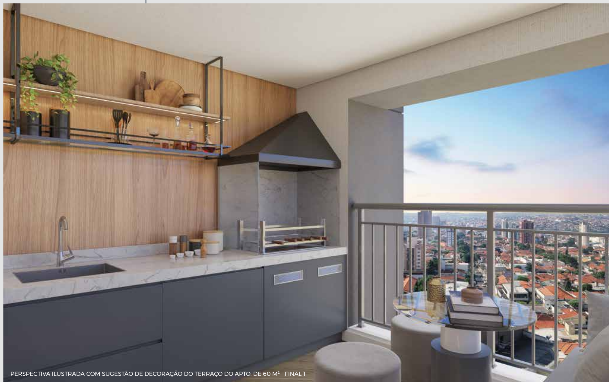
PERSPECTIVA ILUSTRADA COM SUGESTÃO DE DECORAÇÃO DO TERRAÇO DO APTO. DE 60 M 2 - FINAL 1

QUALQUER MODIFICAÇÃO NO APARTAMENTO QUE IMPLIQUE NA ALTERAÇÃO DO PROJETO ORIGINAL DA FACHADA DEVERÁ SER APROVADA NA ASSEMBLEIA DO CONDOMÍNIO. EVENTUAIS ADEQUAÇÕES NAS INSTALAÇÕES ELÉTRICAS E/OU HIDRÁULICAS SERÃO POR CONTA E RESPONSABILIDADE DO CLIENTE, DEVENDO OBSERVAR AS RECOMENDAÇÕES INDICADAS NO MANUAL DO PROPRIETÁRIO.