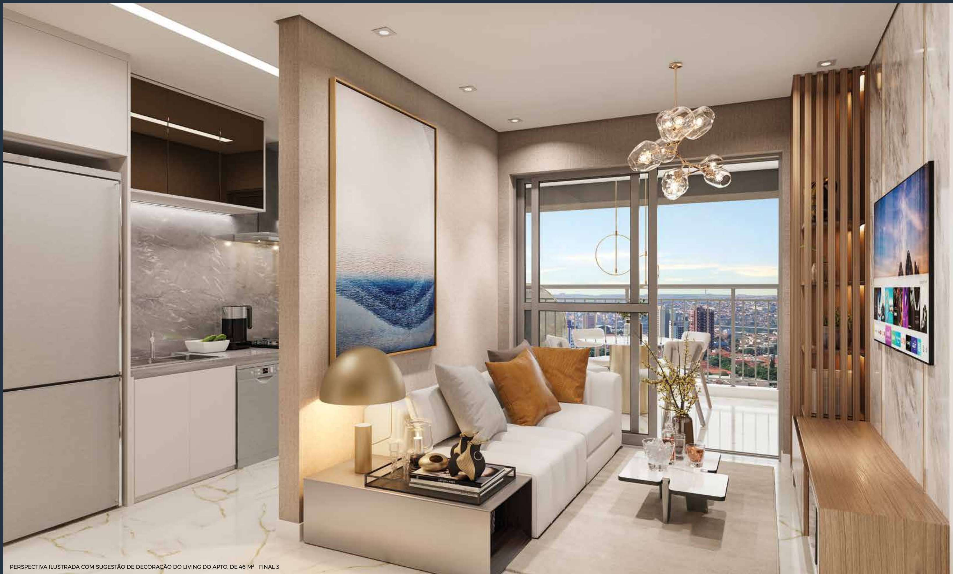
PERSPECTIVA ILUSTRADA COM SUGESTÃO DE DECORAÇÃO DO LIVING DO APTO. DE 46 M 2 - FINAL 3

QUALQUER MODIFICAÇÃO NO APARTAMENTO QUE IMPLIQUE NA ALTERAÇÃO DO PROJETO ORIGINAL DA FACHADA DEVERÁ SER APROVADA NA ASSEMBLEIA DO CONDOMÍNIO. EVENTUAIS ADEQUAÇÕES NAS INSTALAÇÕES ELÉTRICAS E/OU HIDRÁULICAS SERÃO POR CONTA E RESPONSABILIDADE DO CLIENTE, DEVENDO OBSERVAR AS RECOMENDAÇÕES INDICADAS NO MANUAL DO PROPRIETÁRIO.