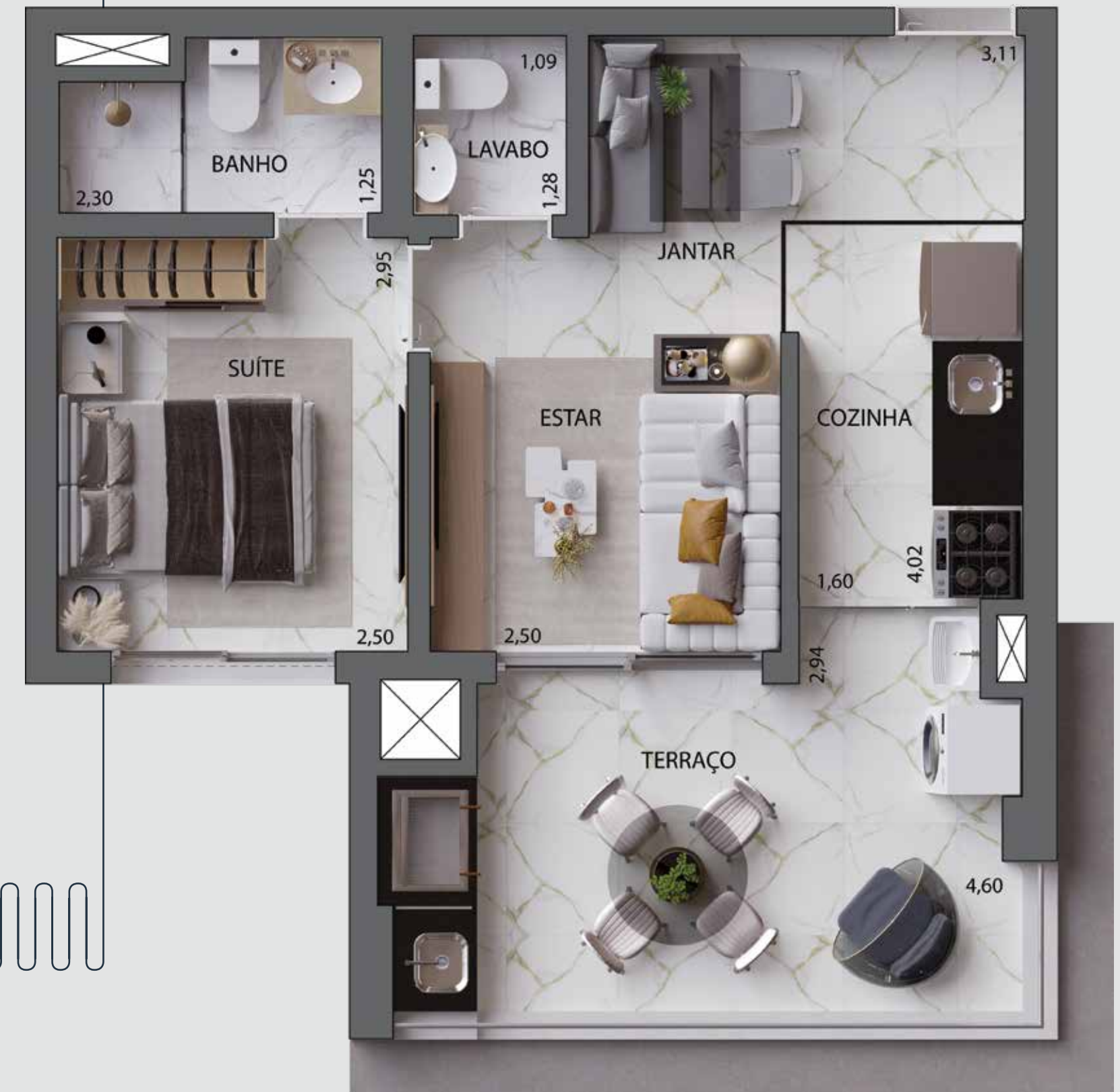
PLANTA COM SUGESTÃO DE DECORAÇÃO DO APTO. DE 46 M 2 - FINAL 3