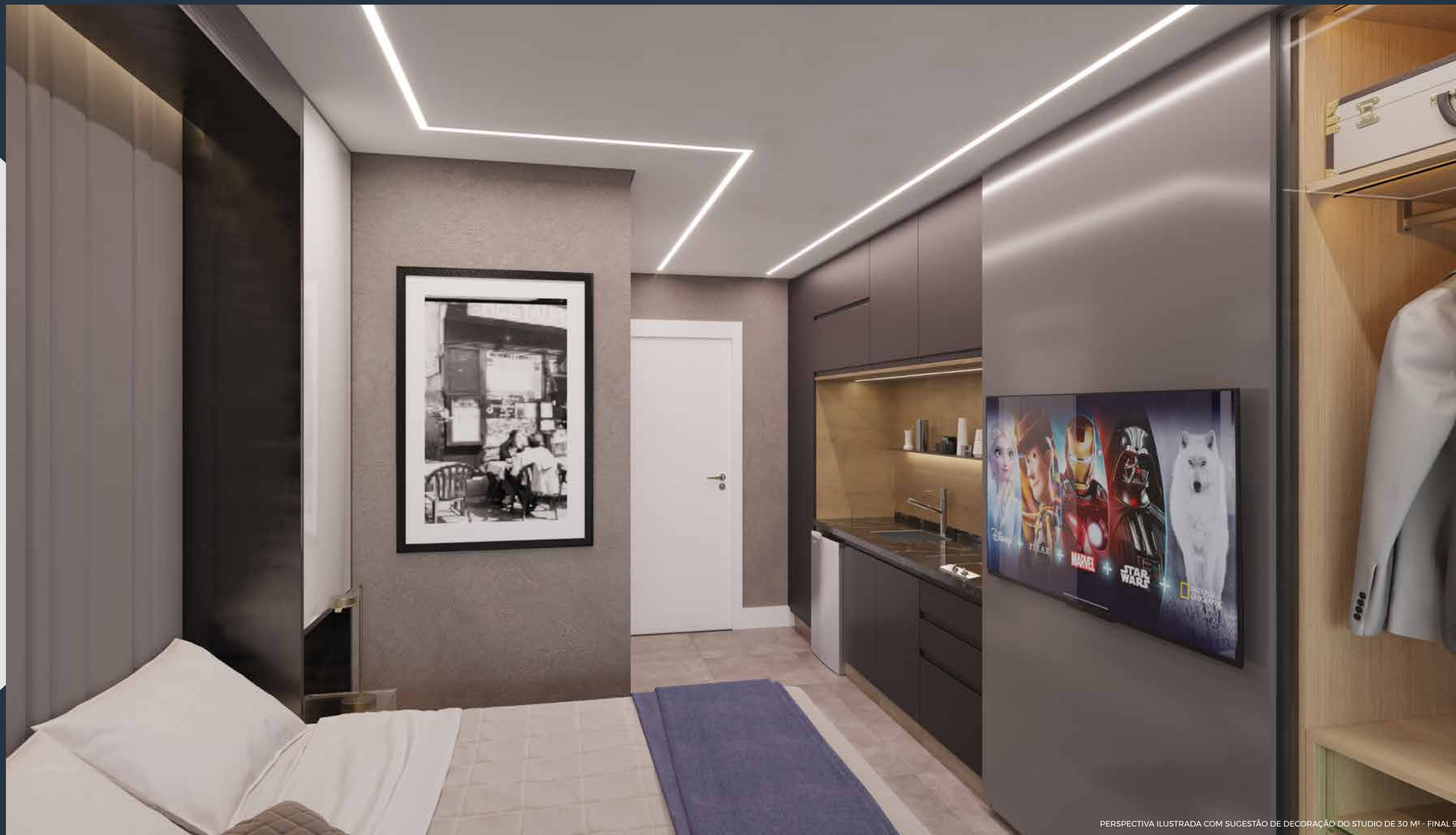
PERSPECTIVA ILUSTRADA COM SUGESTÃO DE DECORAÇÃO DO STUDIO DE 30 M 2 - FINAL 9

QUALQUER MODIFICAÇÃO NO APARTAMENTO QUE IMPLIQUE NA ALTERAÇÃO DO PROJETO ORIGINAL DA FACHADA DEVERÁ SER APROVADA NA ASSEMBLEIA DO CONDOMÍNIO. EVENTUAIS ADEQUAÇÕES NAS INSTALAÇÕES ELÉTRICAS E/OU HIDRÁULICAS SERÃO POR CONTA E RESPONSABILIDADE DO CLIENTE, DEVENDO OBSERVAR AS RECOMENDAÇÕES INDICADAS NO MANUAL DO PROPRIETÁRIO.