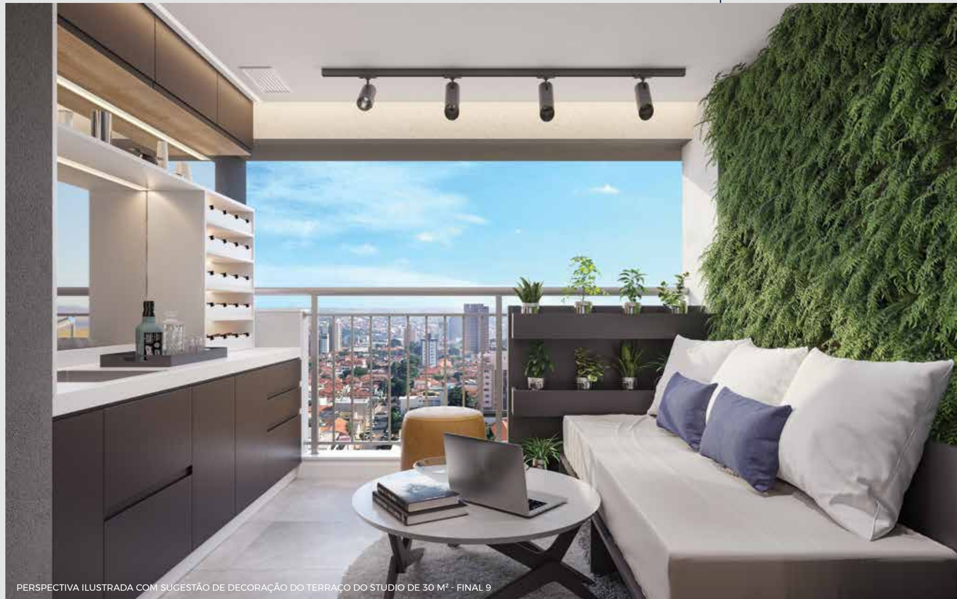
PERSPECTIVA ILUSTRADA COM SUGESTÃO DE DECORAÇÃO DO TERRAÇO DO STUDIO DE 30 M 2 - FINAL 9

QUALQUER MODIFICAÇÃO NO APARTAMENTO QUE IMPLIQUE NA ALTERAÇÃO DO PROJETO ORIGINAL DA FACHADA DEVERÁ SER APROVADA NA ASSEMBLEIA DO CONDOMÍNIO. EVENTUAIS ADEQUAÇÕES NAS INSTALAÇÕES ELÉTRICAS E/OU HIDRÁULICAS SERÃO POR CONTA E RESPONSABILIDADE DO CLIENTE, DEVENDO OBSERVAR AS RECOMENDAÇÕES INDICADAS NO MANUAL DO PROPRIETÁRIO.