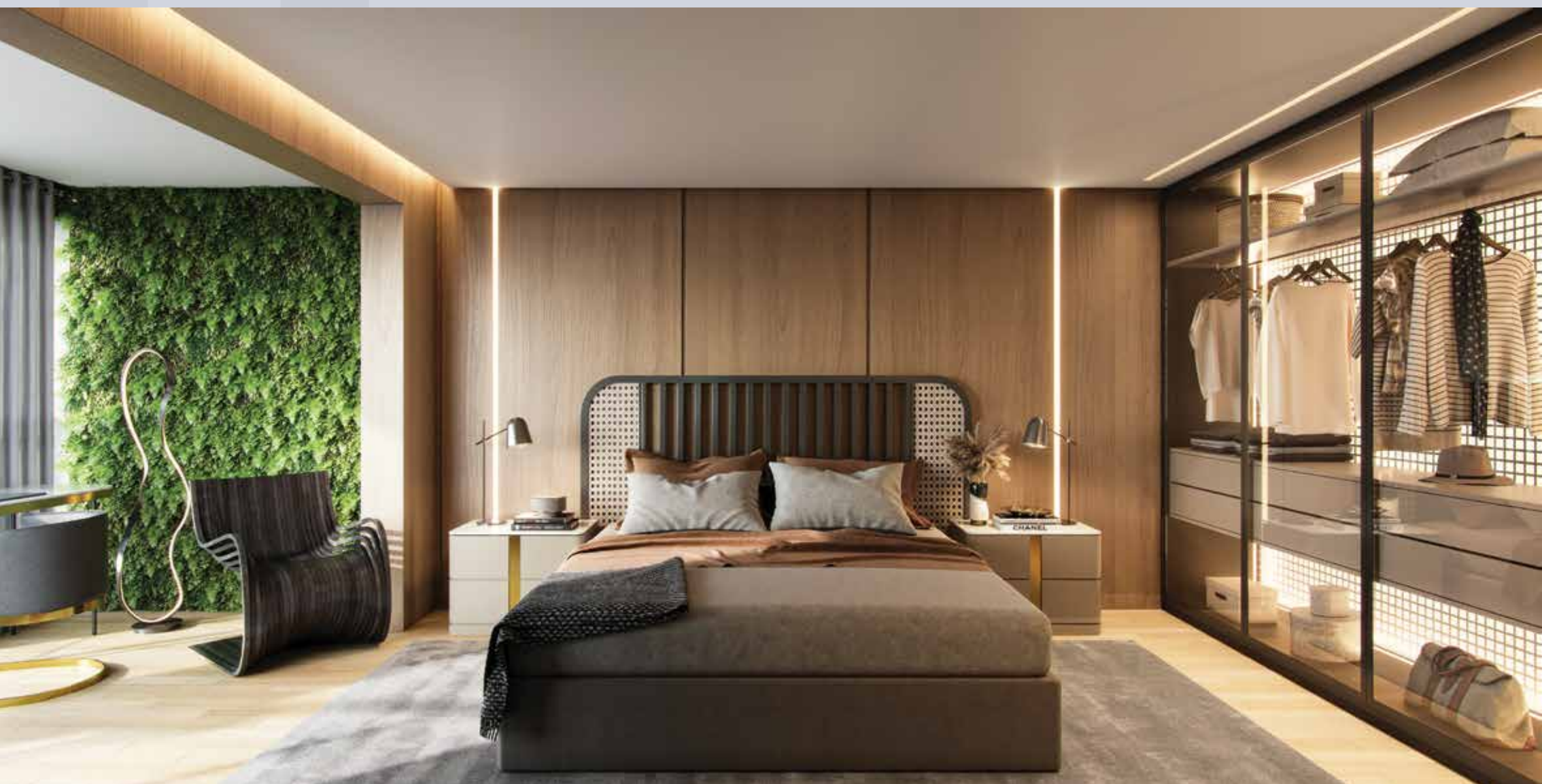
PERSPECTIVA ILUSTRADA DA SUÍTE MASTER DO APTO. DE 185 M 2 COM SUGESTÃO DE DECORAÇÃO - FINAL 1

SUGESTÃO DE DECORAÇÃO. EVENTUAIS ADEQUAÇÕES NAS INSTALAÇÕES ELÉTRICAS E/OU HIDRÁULICAS SERÃO POR CONTA DOS CLIENTES. QUALQUER MODIFICAÇÃO NO APARTAMENTO QUE IMPLIQUE NA ALTERAÇÃO DO PROJETO ORIGINAL DA FACHADA DEVERÁ SER APROVADO EM ASSEMBLEIA DO CONDOMÍNIO.