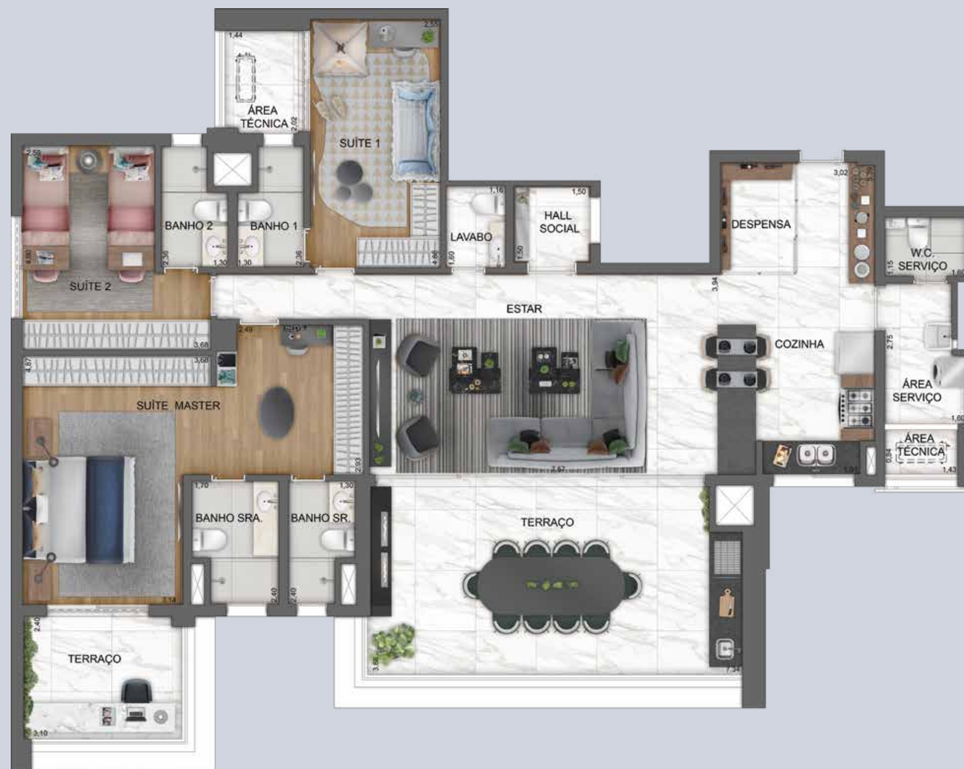
PLANTA OPÇÃO DO APTO. DE 185 M 2 COM SUGESTÃO DE DECORAÇÃO - FINAL 1