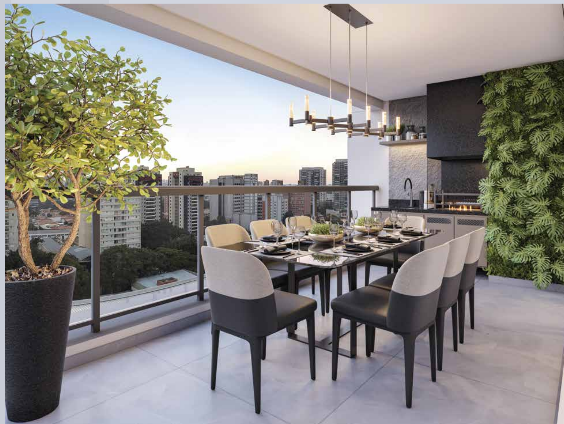
PERSPECTIVA ILUSTRADA DO TERRAÇO DO APTO. DE 138 M 2 COM SUGESTÃO DE DECORAÇÃO - FINAL 4

SUGESTÃO DE DECORAÇÃO. EVENTUAIS ADEQUAÇÕES NAS INSTALAÇÕES ELÉTRICAS E/OU HIDRÁULICAS SERÃO POR CONTA DOS CLIENTES. QUALQUER MODIFICAÇÃO NO APARTAMENTO QUE IMPLIQUE NA ALTERAÇÃO DO PROJETO ORIGINAL DA FACHADA DEVERÁ SER APROVADO EM ASSEMBLEIA DO CONDOMÍNIO.