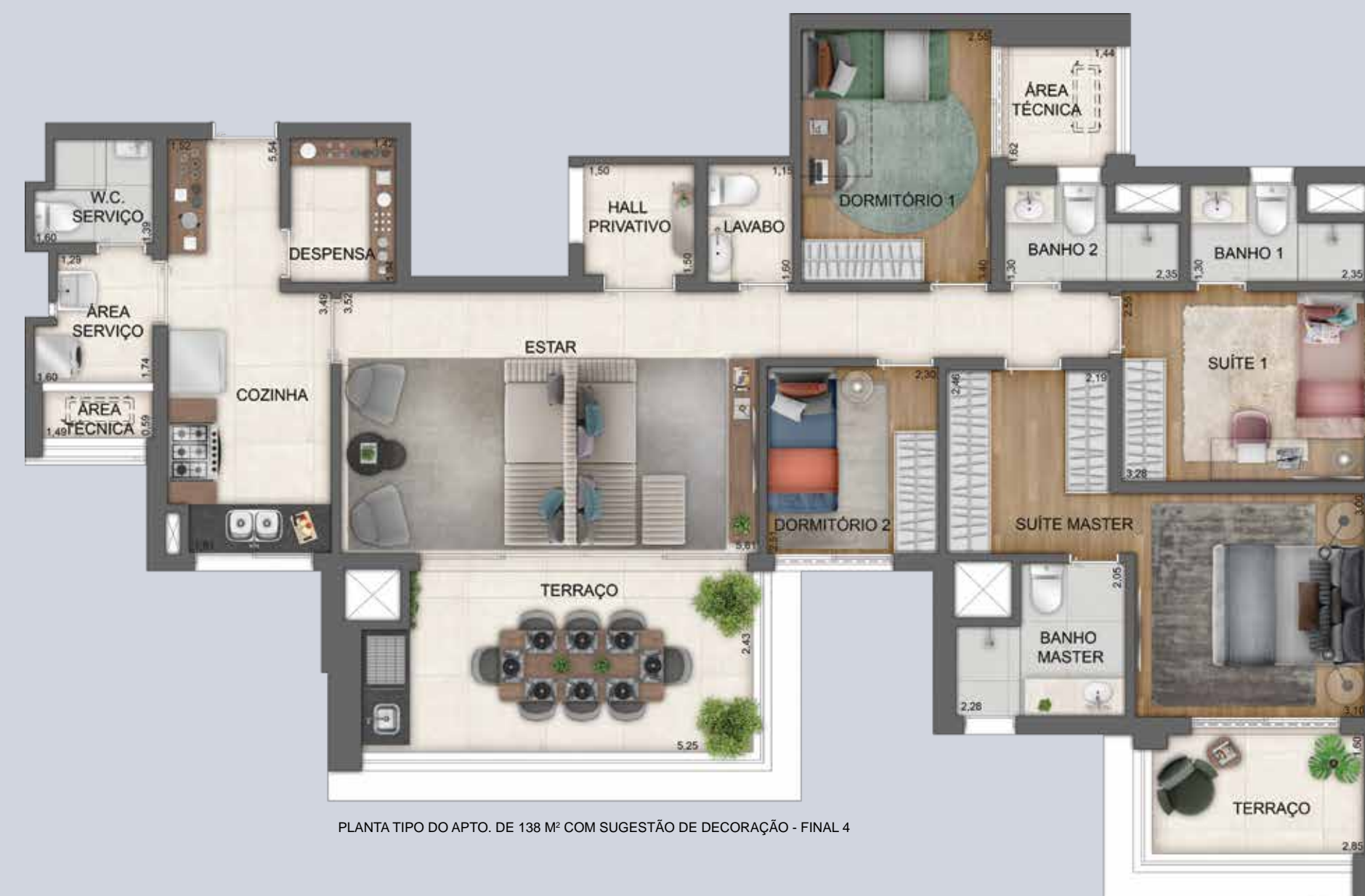
PLANTA TIPO DO APTO. DE 138 M 2 COM SUGESTÃO DE DECORAÇÃO - FINAL 4