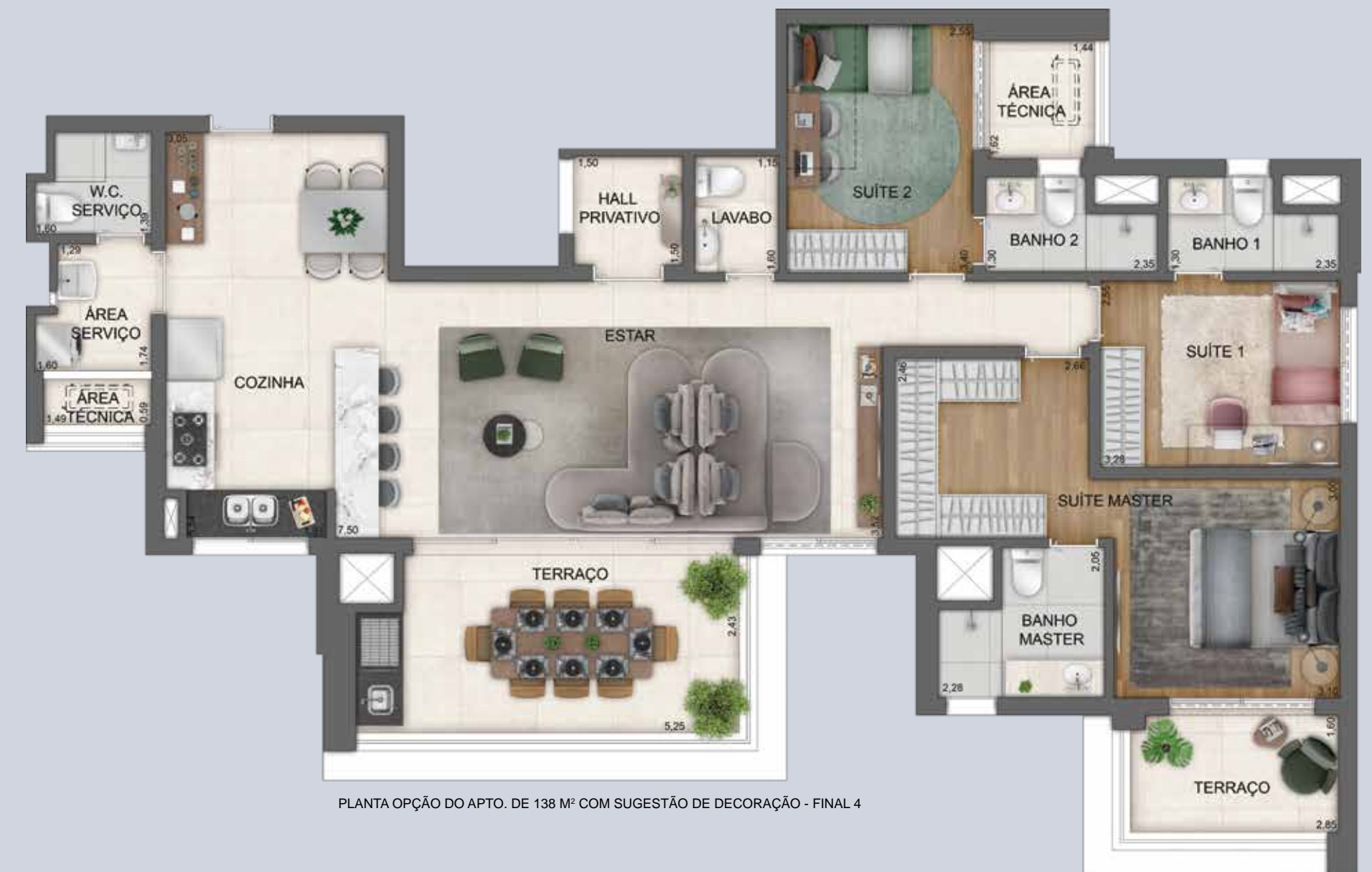
PLANTA OPÇÃO DO APTO. DE 138 M 2 COM SUGESTÃO DE DECORAÇÃO - FINAL 4