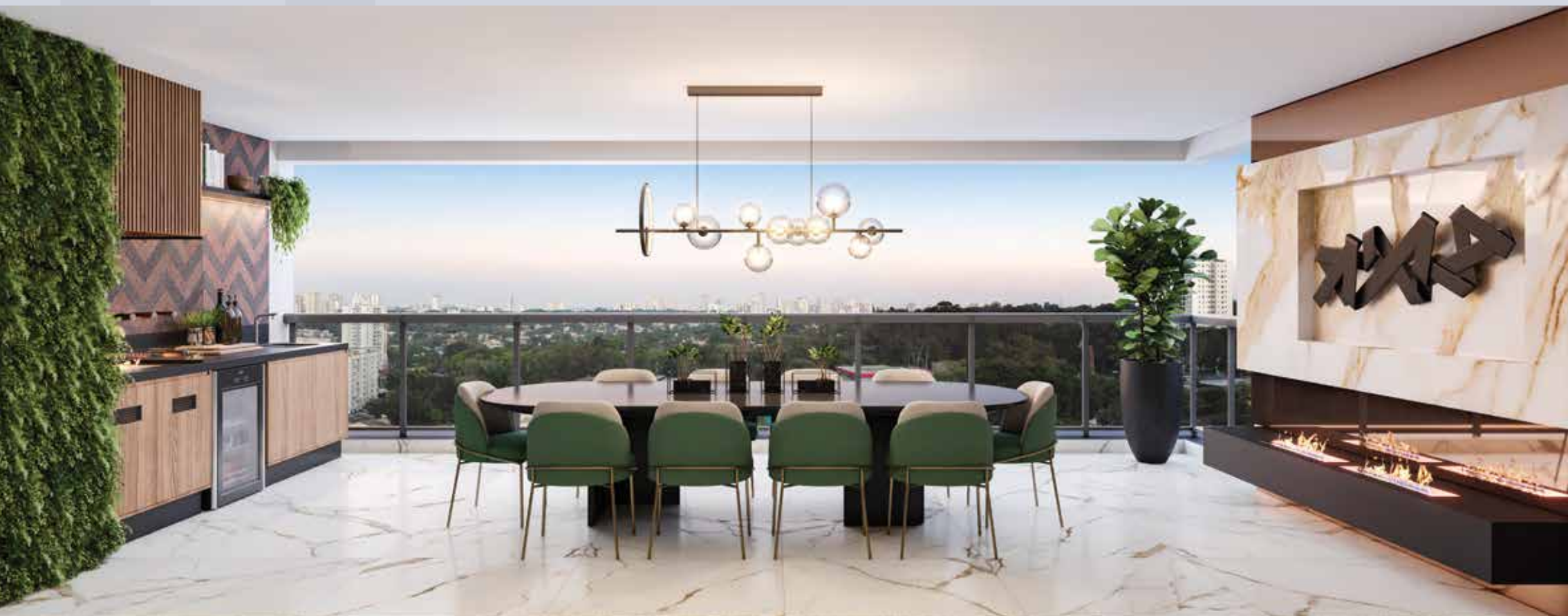
PERSPECTIVA ILUSTRADA DO TERRAÇO DO APTO. DE 185 M 2 COM SUGESTÃO DE DECORAÇÃO - FINAL 1

SUGESTÃO DE DECORAÇÃO. EVENTUAIS ADEQUAÇÕES NAS INSTALAÇÕES ELÉTRICAS E/OU HIDRÁULICAS SERÃO POR CONTA DOS CLIENTES. QUALQUER MODIFICAÇÃO NO APARTAMENTO QUE IMPLIQUE NA ALTERAÇÃO DO PROJETO ORIGINAL DA FACHADA DEVERÁ SER APROVADO EM ASSEMBLEIA DO CONDOMÍNIO.