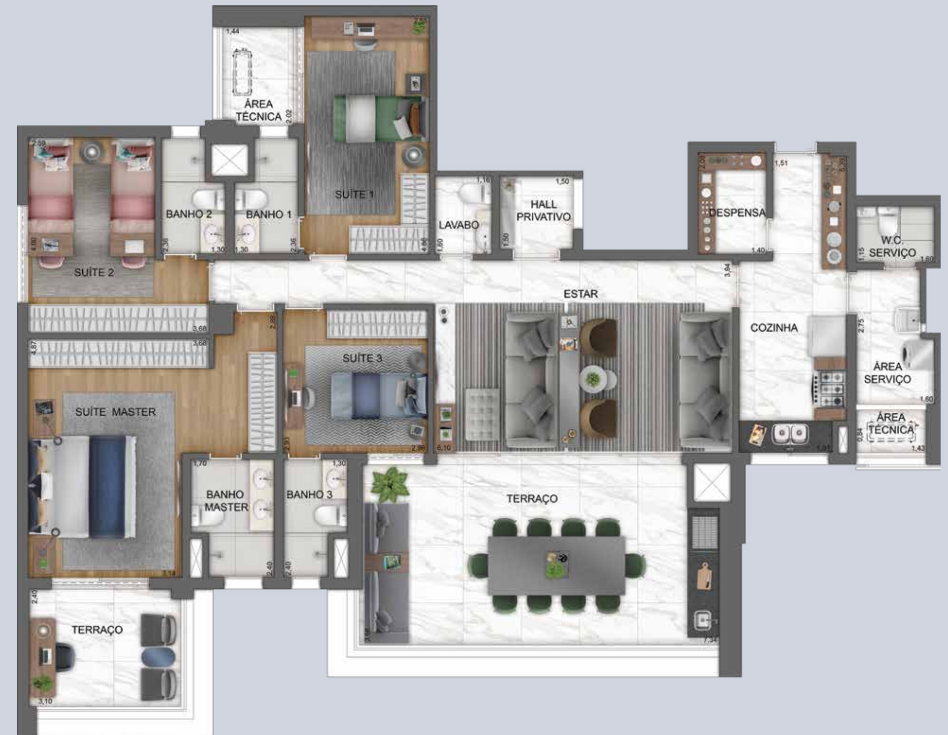
PLANTA TIPO DO APTO. DE 185 M 2 COM SUGESTÃO DE DECORAÇÃO - FINAL 1